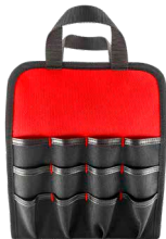
INCLUYE PORTAHERRAMIENTAS extraíble con 48 bolsillos.