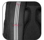
CINTAS REFLEJANTES en parte frontal y tirantes.