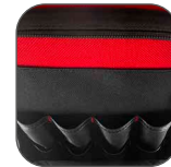
BOLSA FRONTAL con 8 bolsillos.